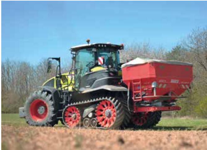
Foto 7. Tractor Claas Axion con semiorugas Terra Trac.