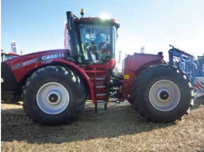
Foto 2. Tractor Case IH Steiger 450 articulado.

La mayoría de los fabricantes ofertan tractores de alta potencia desde 200 CV hasta 700 CV, con excepciones de alguna marca que llega a incorporar motores de hasta 900 CV, como el modelo 9RX 830 de John Deere que cuenta con 913 CV de potencia. Además, al igual que en gamas inferiores de potencia, se centran en la fabricación de series de tractores que bajo el mismo “paraguas” comercializan distintos modelos, según configuraciones de las unidades de energía, sistemas de rodadura, transmisiones, etc.