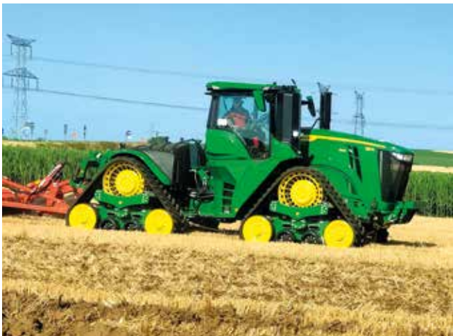
Foto 3. Tractor John Deere 9RX 640 articulado.

En lo relativo a funcionalidades, los tractores de alta potencia se usan de forma habitual en trabajos de laboreo del suelo