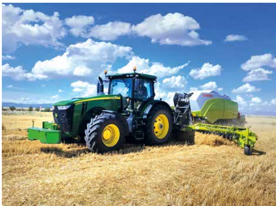
Foto 6. Tractor John Deere 8245 con empacadora con rastrillo delantero.

En los casos de ruedas, llegan a montarse neumáticos de 900 mm con llantas de hasta 46 pulgadas. La mayoría de los tractores de gran potencia con ruedas neumáticas disponen de una potencia desde 200 CV hasta 700 CV, mientras que los dotados de bandas de goma disponen de motores más potentes, desde 330 CV hasta 700 CV, con algún caso de hasta 900 CV. En cuanto al peso en