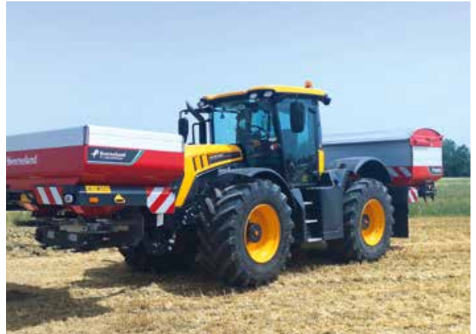
Foto 8. Tractor JCB Fastrac con equipo de abonado en elevador delantero y trasero.

de gases contaminantes y de partículas. Disponen de volúmenes de cilindrada de 7 a 15 litros, dependiendo de modelos y fabricantes, con tecnología de 4 válvulas, consiguiendo aportes de energía mecánica de importancia tanto en cuanto a par como en cuanto a potencia a bajas vueltas de motor con sistemas de gestión electrónicos.