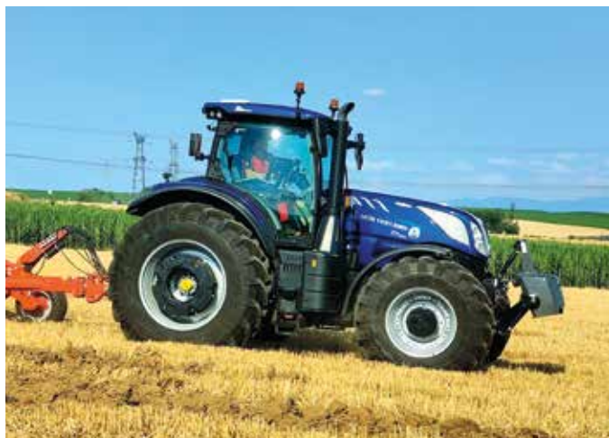
Foto 4. Tractor New Holland T7 300 con apero de laboreo de suelo.