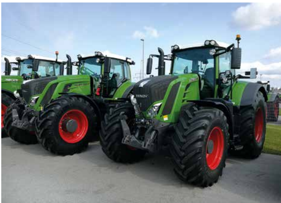
Foto 1. Grupo de tractores de alta potencia Fendt.

Los tractores de gran potencia son adquiridos por grandes explotaciones o por empresas de servicios para ser utilizados un elevado número de horas al año, principalmente en labores de preparación del terreno. Los últimos datos de mercado indican que el sector se dirige hacia una disminución en el número de unidades incorporadas a la actividad agraria pero cada vez más potentes.