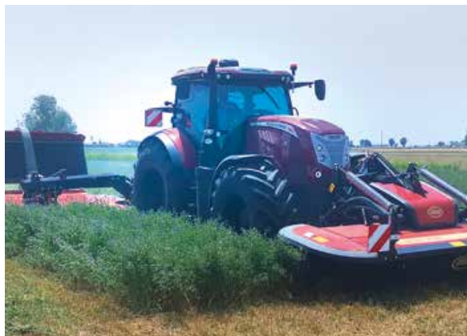
Foto 5. Tractor McCormick X7.624 con segadora frontal y trasera.

(foto 4), pero también en trabajos con diferentes tipos de aperos con altas capacidades de trabajo (fotos 5 y 6).