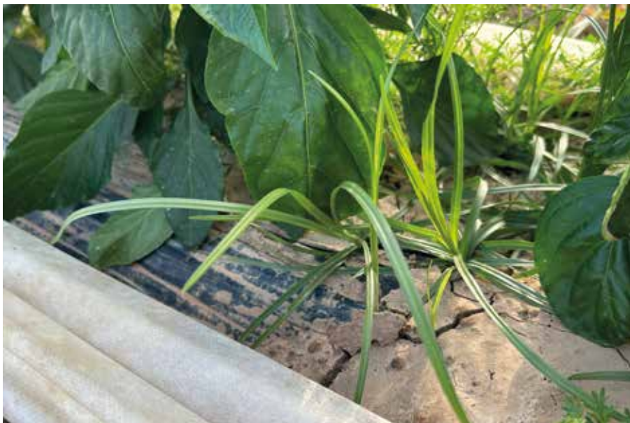
Foto 7. Cyperus rotundus atravesando un plástico opaco en cultivo de pimiento en Meliana (Valencia).

En el cuadro II se exponen todas las materias activas autorizadas a comienzos de junio de 2024. En la segunda columna aparece una información interesante y clave para prevenir el problema de la aparición de malas hierbas resistentes a los herbicidas. Se trata del grupo de mecanismo de acción del herbicida, designado por el organismo “Herbicide Resistance Action Committee” (HRAC). Es necesario rotar no solo los cultivos sino el grupo HRAC de materia activa herbicida para evitar la aparición de malas hierbas resistentes.