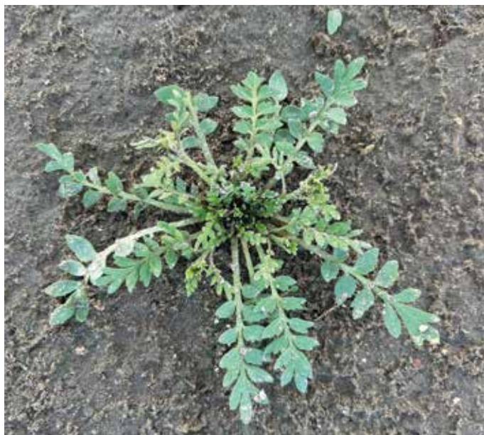
Foto 2. Planta de Coronopus didymus en la huerta de Valencia.