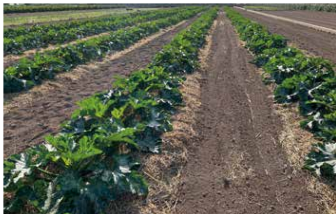
Foto 6. Mulch orgánico (paja de arroz) en cultivo de calabacín en Meliana (Valencia).