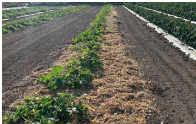
Foto 5. Mulch orgánico (triturado de planta de maíz y paja de arroz) en cultivo de melón en Meliana (Valencia).

Instalación en la línea del cultivo de paja de cereal (arroz, cereal de invierno o maíz triturado) a una dosis de 1-2 kg/m 2 aproximadamente, para evitar la emergencia,