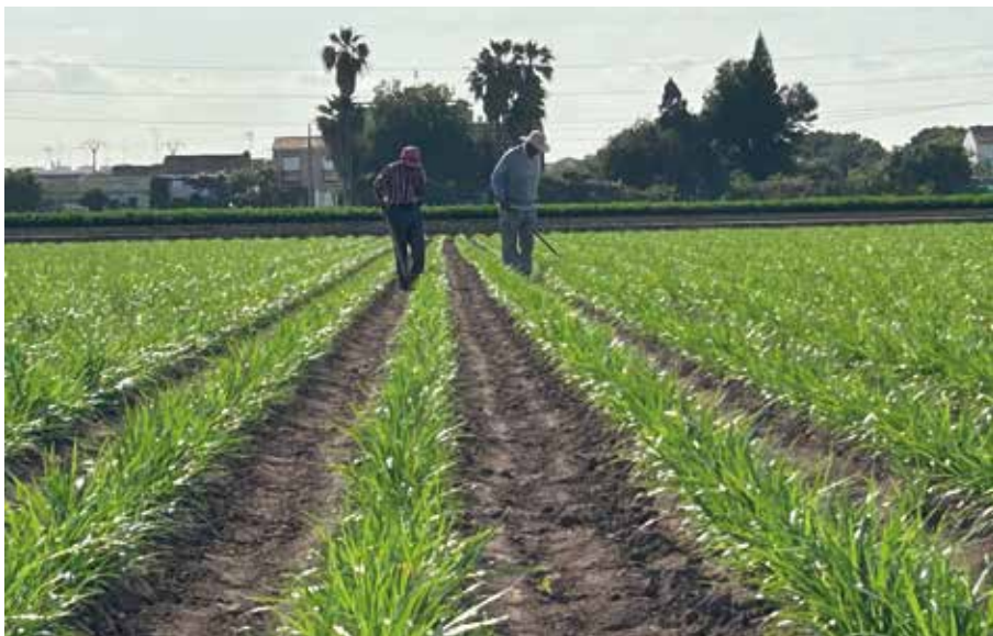
Foto 4. Escarda manual en el cultivo de la chufa en Alboraya (Valencia).

Mediante el uso de cualquier herramienta ligera, sobre todo contra malas hierbas