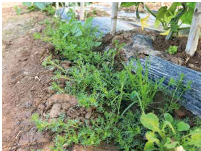
Foto 3. Coronopus didymus instalada entre el plástico y la calle labrada.